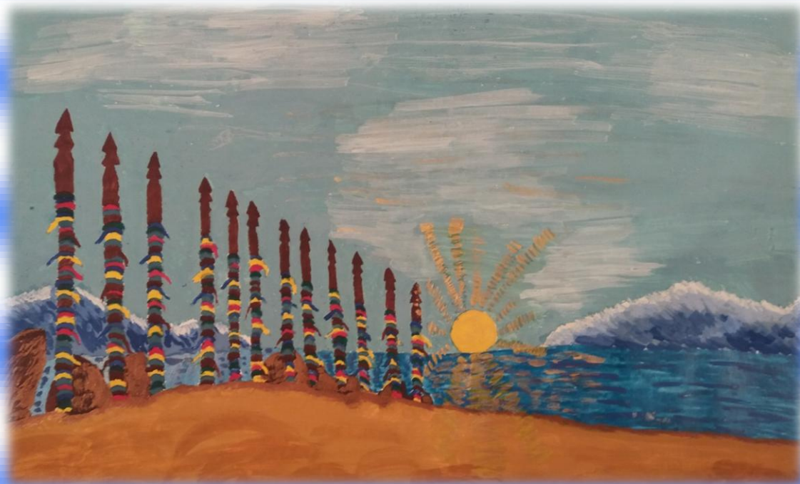
«Сакральные места на Байкале», Зулкупарова Элнур, 4 класс МБОУ г. Иркутска СОШ №9